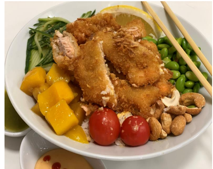
LAX TEMPURA BOWL

Friterade laxbitar på en bas av specialris med strimlad gurka, avokado, sojabönor, cocktailtomater & citron. Serveras med Sushikungens hemgjorda chilimajonnäs och nyttiga, gröna chilisås