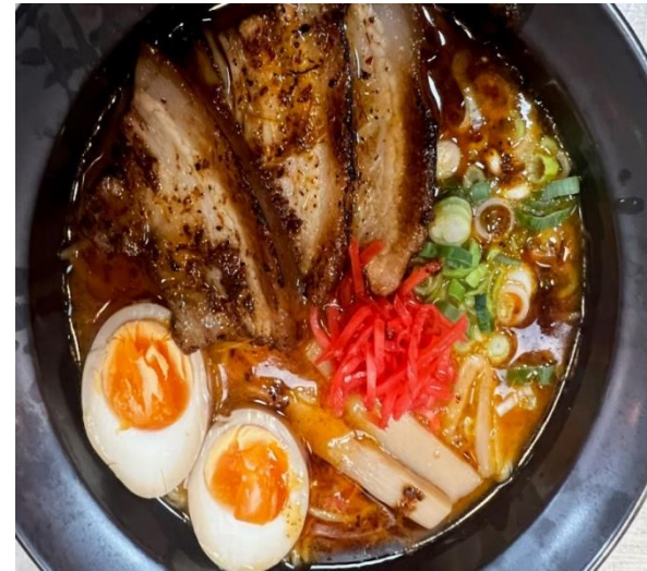
Tonkotsu Spicy Miso

Marinad till fläsk/kyckling: Färsk ingefära, vitlök, sojasås, mirin, saké, honung & diverse kryddor