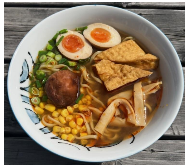
Veggie Shoyu Tofu

Marinad till tofu: Färsk ingefära, vitlök, sojasås, mirin, saké, honung & diverse kryddor